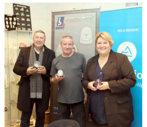
Savoir-faire local chez Bruot, avec plus d'une centaine de nouveautés chaque année. Un exemple du « Made in France ».