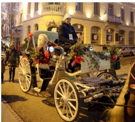
Le Père Noël s'est déplacé en calèche dans les rues du centre-ville.