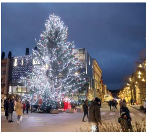
Le sapin a été placé devant l'Hôtel de Ville, avec la fameuse boîte aux lettres du Père Noël.